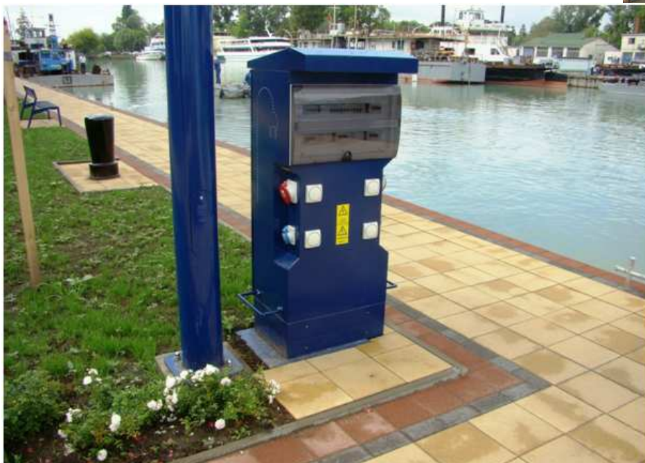
elektromos töltőrendszer a siófoki kikötőben